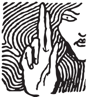
Hungarian Helsinki Committee

تۆ له مهجرستانیت. زمانی فہرمی ولات مهجریه. مهجرستان ئہندامی یهکیهتی ئهروپایه، وکوتوتته نیوجهرگی ئهروپا.