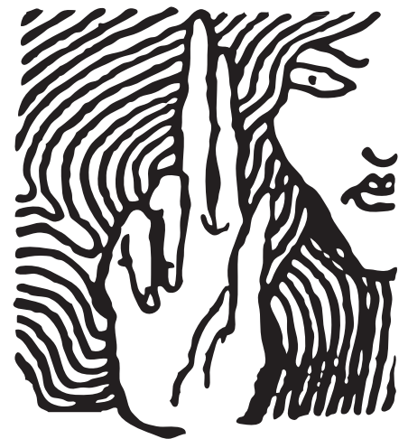
Hungarian Helsinki Committee

Si vous ne pouvez pas dormir, si vous avez de mauvais souvenirs, demandez les psychologues de la Fondation Cordelia (service gratuit). Renseignez-vous auprès des assistants sociaux sur leur disponibilité.