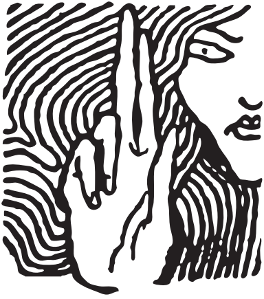
Hungarian Helsinki Committee

أنت الآن في هنغاريا (المجر). اللغة الرسمية هنا هي اللغة الهنغارية (المجرية)، هنغاريا هي دولة من دول الاتحاد الأوروبي وهي من دول أوروبا الوسطى-الشرقية.