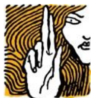
Hungarian Helsinki Committee

A menekülttáborban kapsz egy ágyat , és napi 3-szor élelmet (vagy pénzt kapsz, hogy vásárolj élelmiszert, kb 1000 forintot naponta). Kapsz zsebpénzt , kb. 8000 forintot (=25 EUR) havonta. Kapnod kell egy humanitárius tartózkodási kártyát a személyes adataiddal. Ha egészségi problémád van, rosszul vagy, van orvos a táborban , kérd a segítségét, kapnod kell alapellátást.