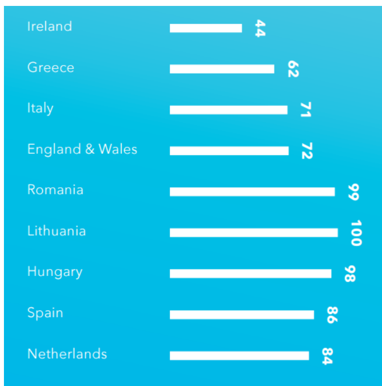
2. ábra – Az ügyészség által benyújtott, előzetes letartóztatási kérelmek bírói elrendelésének százalékos arányai a kutatók által gyűjtött mintákban

„Őszintén szólva valószínűleg soha nem találtam magam olyan helyzetben, amikor bármi, amit a védelem felhozott érvként, meggyőzött volna arról, hogy ne alkalmazzak előzetes letartóztatást.”