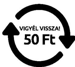
Egyszer használatos, egyutas palack jelölése

Az átvétel során – a jogszabályi környezetnek megfelelően – csak az Eljárásrendben is meghatározott deformitás mentes, sértetlen, kupakkal ellátott betétdíjas PET palack kritériumainak megfelelő, a visszaváltáshoz szükséges felirattal és kóddal megjelölt betétdíjas termékek kerülnek visszavételre.