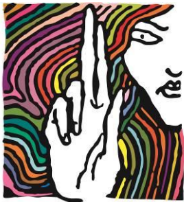
Magyar Helsinki Bizottság