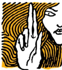
Magyar Helsinki Bizottság