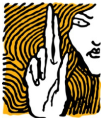
Magyar Helsinki Bizottság

Ráadásul a főkapitány a saját intézkedése elleni panaszt bírálta el, ezért annak elintézésében a budapesti főkapitány a törvény értelmében nem is vehetett volna részt. Az ORFK hatályon kívül helyezte a BRFK döntését és új eljárást rendelt el. Ennek eredményeként a BRFK bár részlegesen, de ismét elutasította a Bizottság panaszát, így a Fővárosi Bíróságnál pert kezdeményeztünk a határozat ellen, amely 2007 végén még folyamatban volt.